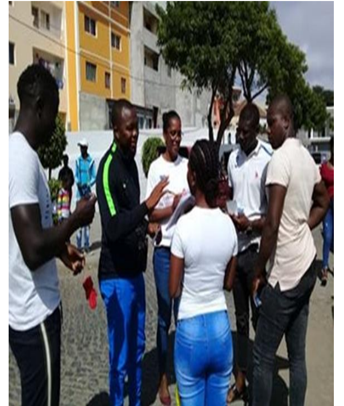
Terminal rodoviário (cont.)