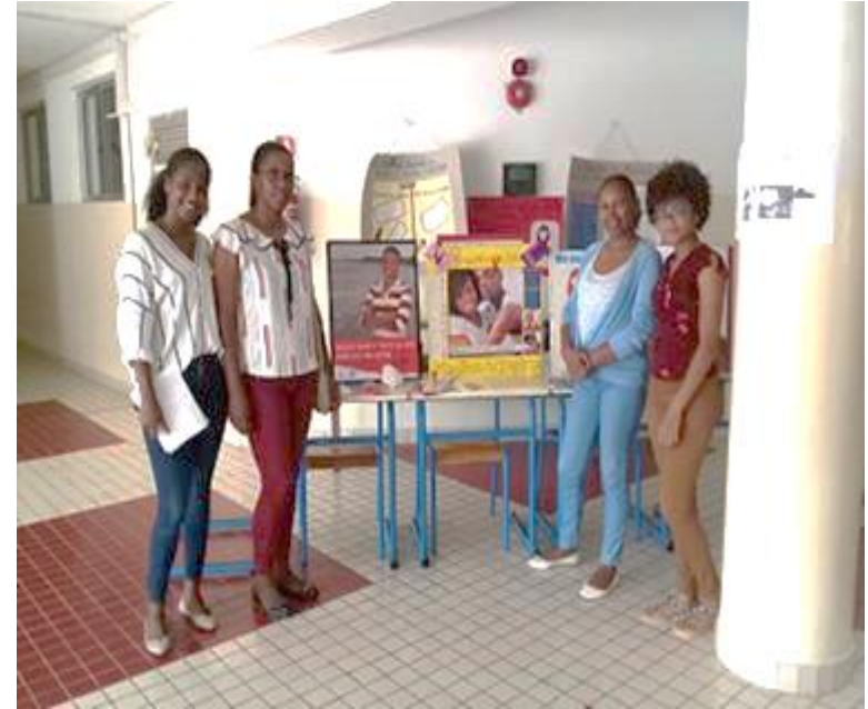
Escola Técnica Grão Duque Henri (Cont.)