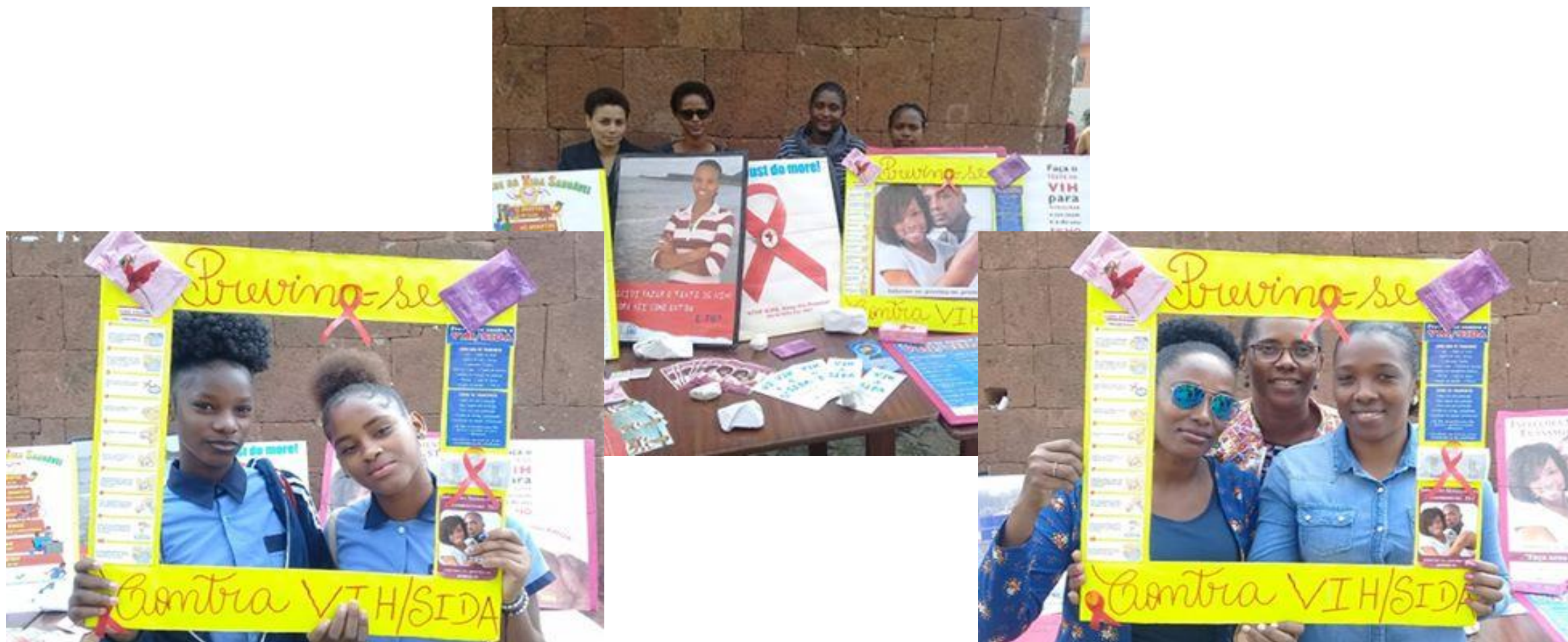
Liceu Amílcar Cabral (Cont.)