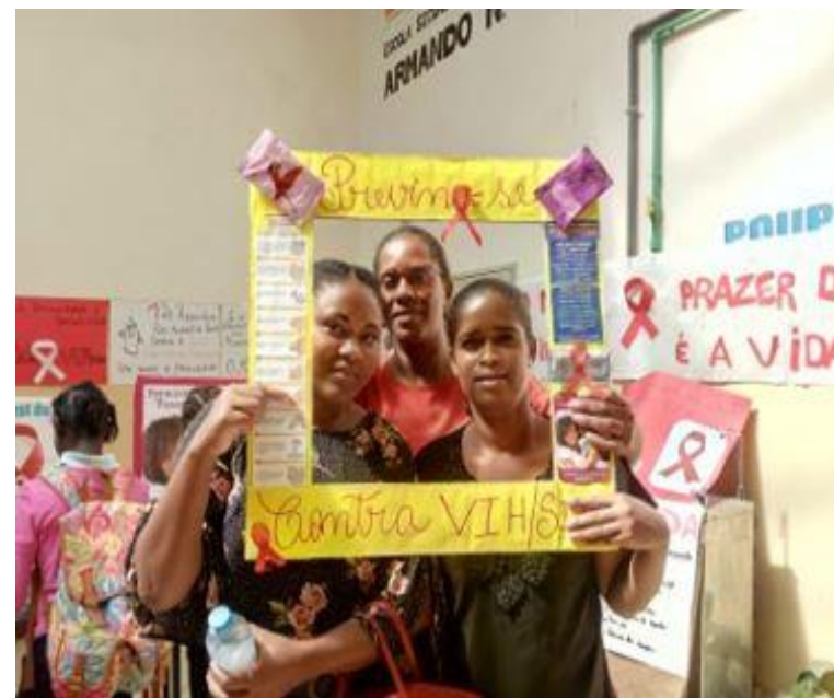
Escola Secundária Armando Napoleão Fernandes (Cont.)